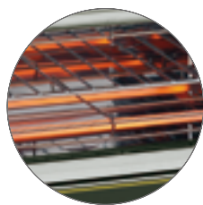
Grilles protège-tubes (brevetées) / Protection grids for tubes (patented)