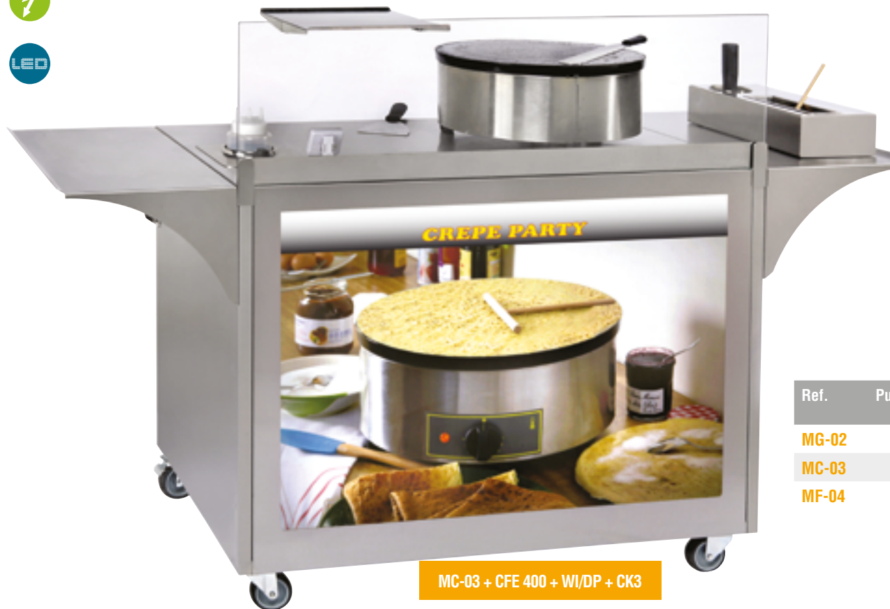
MC-03 + CFE 400 + WI/DP + CK3