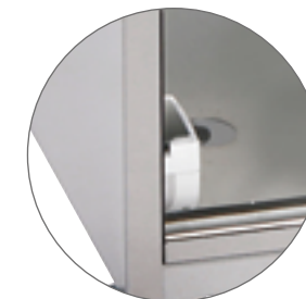
2 prises / sockets