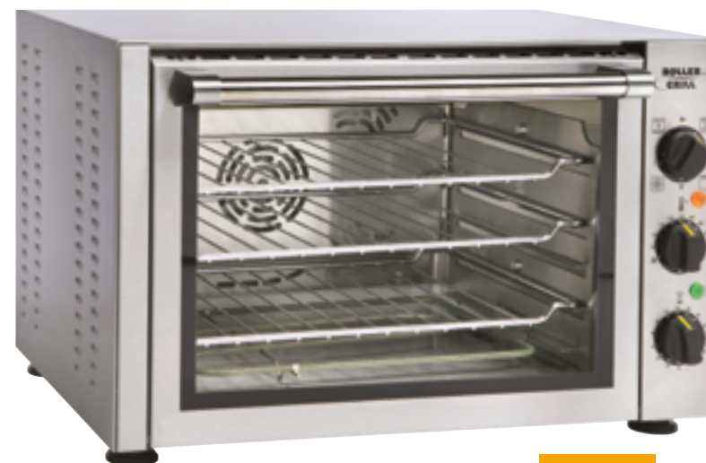
FC 380 TQ