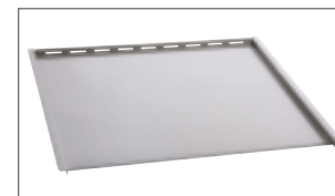
Plat / Tray (FC 380 TQ)