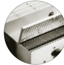
Boîtier de contrôle + ventilation / Control box + ventilation