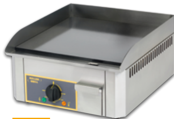
PSR 400 EE

Version gaz : 1 ou 3 brûleurs en étoile à 6-8 branches, allumage Piezo, thermocouples de sécurité. Livrée en butane/propane avec pochette d'injecteurs GN.