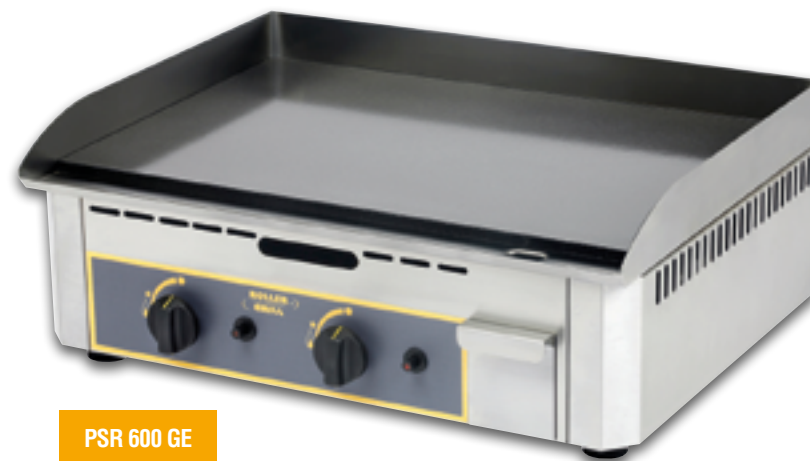
PSR 600 GE