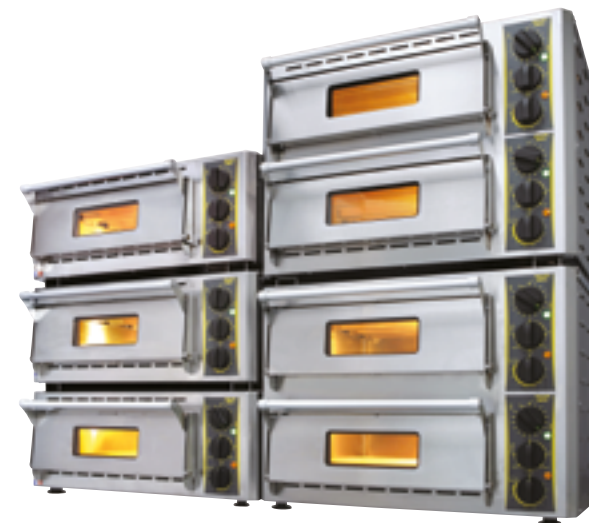
Fours superposés avec kit KPZ 430 / Stackable ovens with kit KPZ 430