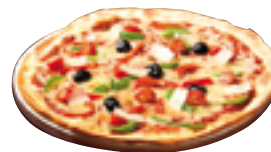
Pizza Ø 41 cm/16"

Régulation de la sole selon l'épaisseur de la pizza / Regulation of firestone according to thickness of pizza base