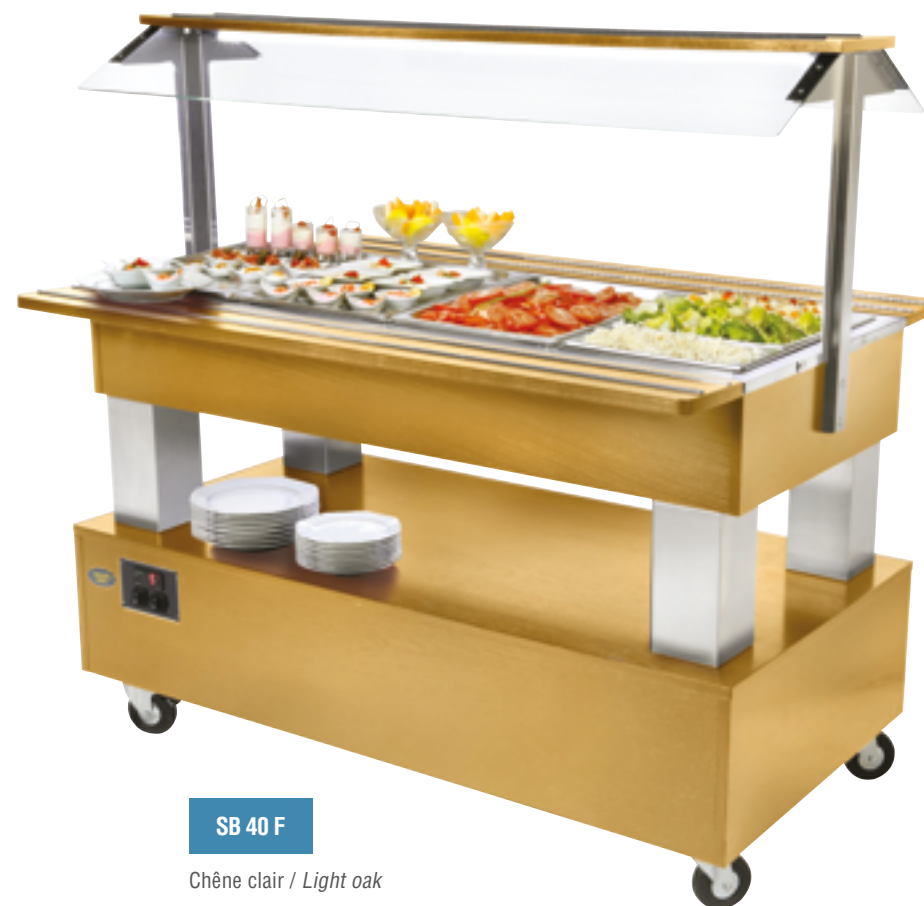
SB 40 F

Éléments communs : pare-haleine en verre, LED blanc-froid, profilé alu sur tablettes rabattables et démontables (1370 x 165 mm) pour le passage de portes standards 0,8 m, poternes en inox brossé, 4 roues pivotantes dont 2 avec frein, accès direct pour l'entretien, adaptés à tous bacs GN (H : 150 mm maxi). Livrés sans bac GN.