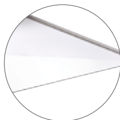
Toit en verre / Glass top