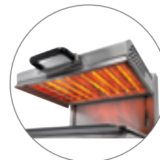
Quartz infrarouges / Infrared quartz tubes (1050°C)