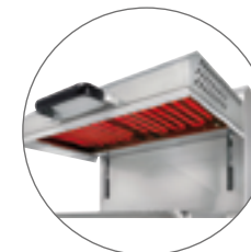
Résistances blindées / Metal heating elements