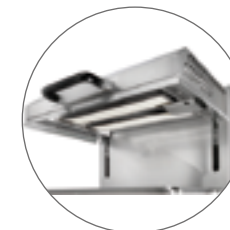
Gaz forte puissance / High power gas